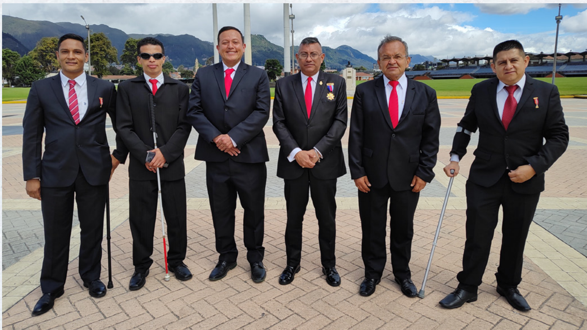
► Veteranos de la Fuerza Pública con y sin discapacidad.

Esta ruta fusiona las de actividad física y habilidades para la vida, y contempla los programas de vida activa productiva y entorno, habilidades sociales y comunicativas, junto con el de gestión social y familia. Estos programas incluyen una variedad de talleres y actividades gratuitas, algunos virtuales y otros presenciales.