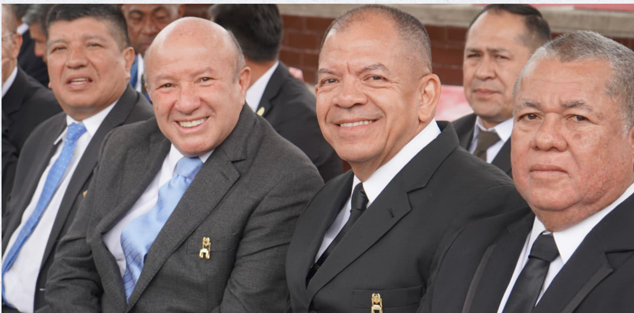
► Veteranos de la Fuerza Pública en la ceremonia de conmemoración del Día del Veterano en Bogotá.

Son los reconocidos como veteranos de la Fuerza Pública y el núcleo familiar de los uniformados fallecidos o desaparecidos por acción directa del enemigo, o en combate, o en tareas de mantenimiento, o restablecimiento del orden público o en conflicto internacional. El núcleo familiar está compuesto por el (la) cónyuge o compañero (a) permanente y los hijos hasta los 25 años de edad, a falta de estos, sus padres.